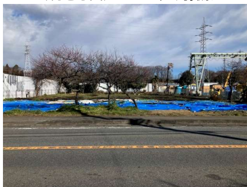
〔現地写真〕 2024年1月撮影

※市街化調整区域につき建築物の建築、コンテナハウス等の設置はできません ※前面道路に上水道本管、電線はありますが本物件への引込はありません ※残土、土砂の堆積、産廃不可